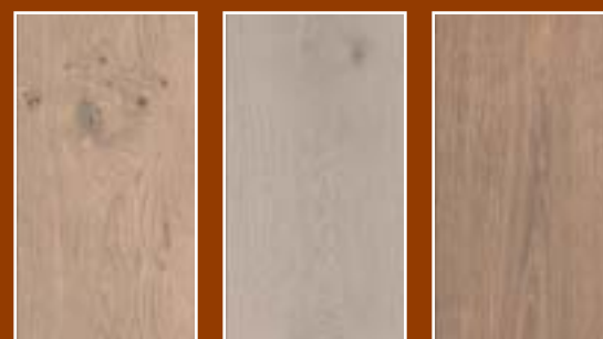
Eiken Carcassonne Eiken Chambord Eiken Versailles