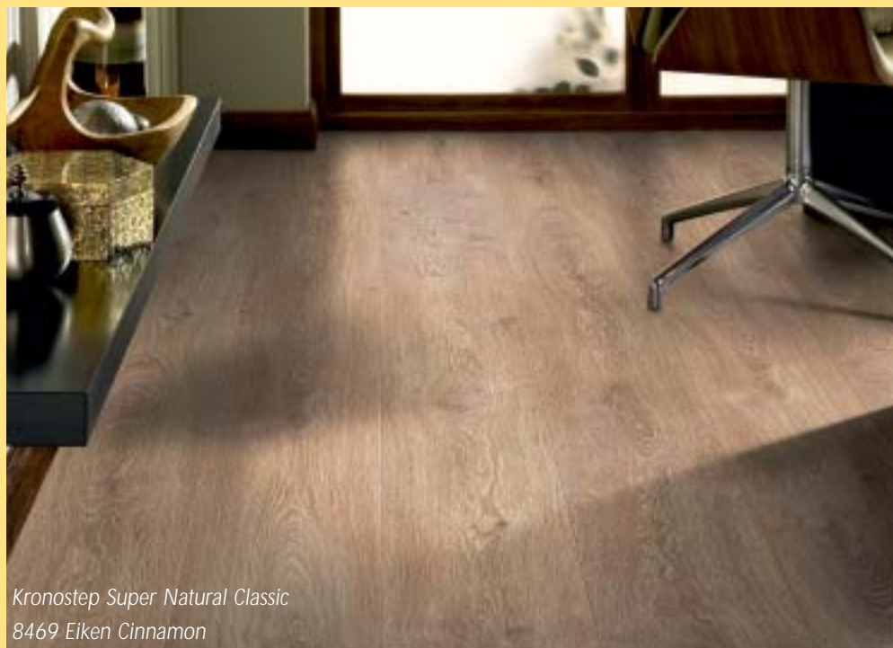
Kronostep Super Natural Classic 8469 Eiken Cinnamon

Er is een uitbreiding op de Krono Original display verkrijgbaar waarin de nieuwe collectie wordt tentoongesteld. De collecties Castello XL Woodline en Kronostep Super Natural Wide Body worden niet meer getoond in de display, maar op imposante 'megaborden'. Deze mooie verkoopbevorderende presentaties zijn zondermeer blikvangers in uw showroom! Vraag ernaar bij uw contactpersoon van de binnen- of buitendienst. U kunt ook telefonisch contact opnemen met Woodpecker via 0297-237400, of per e-mail via info@woodpecker.nl .