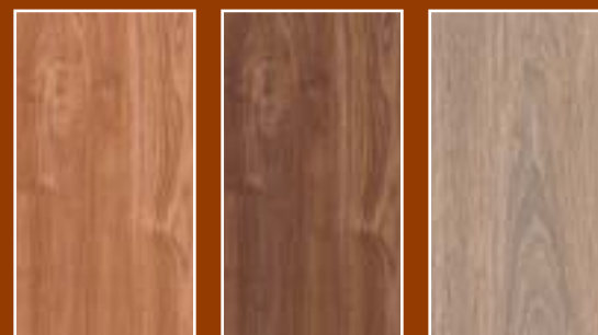
Kersen Pennsylvania Walnoot Richmond Eiken Blond