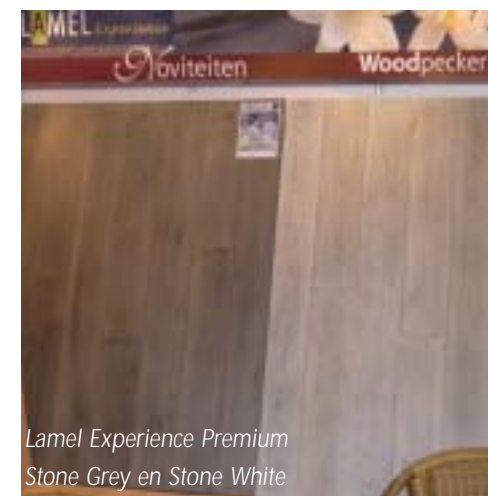
Lamel Experience Premium Stone Grey en Stone White

Op de voorpagina van deze Klopsignalen wordt al uitgebreid aandacht besteed aan de uitbreiding van het assortiment van Krono Original laminaat. Natuurlijk presenterden wij de (ver)nieuw(d)e collecties Kronostep Super Natural Wide Body, Castello XL Stone Impression en Castello XL Woodline, samen