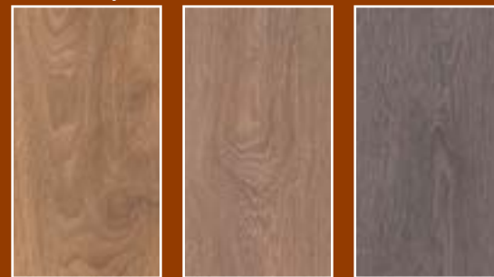
Eiken Harlech Eiken Havana Eiken Loft