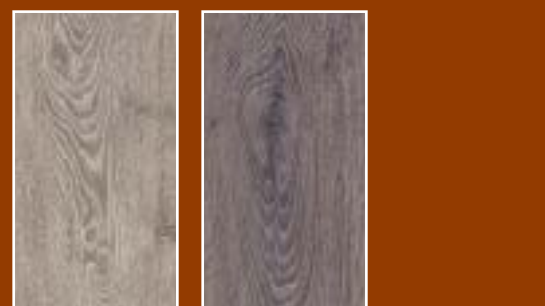
Eiken Weathered Eiken Studio