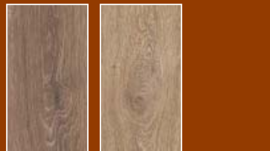
Eiken Harbour Eiken Cinnamon