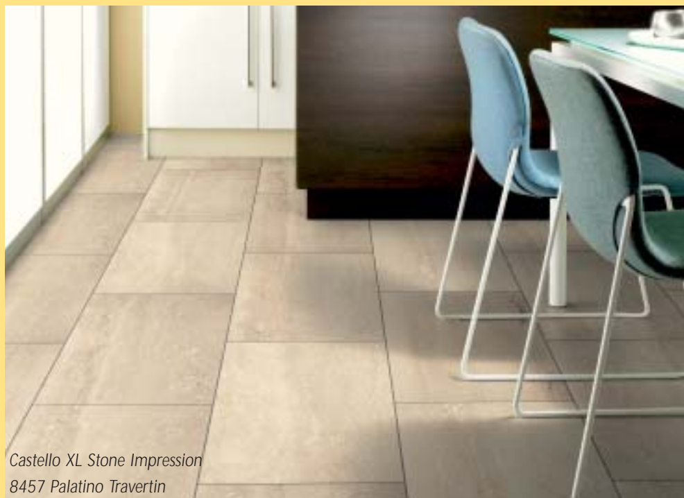
Castello XL Stone Impression 8457 Palatino Travertin

Castello XL Stone Impression verleidt de consument die van een natuurstenen vloer houdt, maar bespaart hem de zware opgave van het tillen van zware massieve natuurstenen tegels! Het is dan ook een buitengewoon